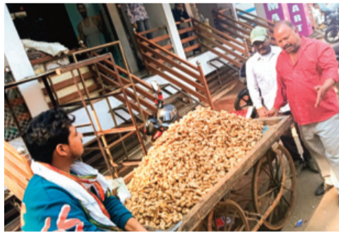
हरिभूमि न्यूज ▶▶ राजगढ़

राजगढ़ नगर में हर बुधवार साप्ताहिक हाट-बाजार लगता है जिसमें सैकड़ों की संख्या में दुकानदार सहित अन्य लोग आया करते हैं। ऐसे में सुगम यातायात के दृष्टिकोण से दो वर्ष पूर्व नगर पालिका ने मेन मार्केट के सब्जी विक्रेताओं को हर बुधवार अपनी दुकानें दशहरा मैदान में लगाने की हिदायत दी थी। शुरुआत में तो सब्जी विक्रेताओं ने इसका पालन किया लेकिन बीते कुछ हफ्तों