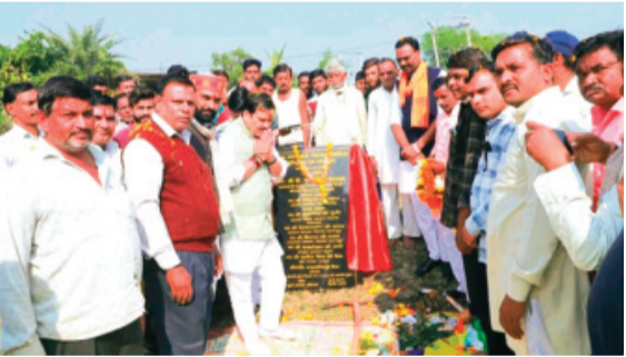
पंचायत कार्रिया में अटल पंचायत भवन के जनकल्याणकारी कार्यों ने ग्रामीणों में विकास

सारंगपुर। बुधवार को सारंगपुर विधानसभा क्षेत्र के ग्राम बावली में 2 करोड़ 40 लाख रुपये की लागत से बनने वाले नए विद्युत ग्रिड का भूमि पूजन मंत्री गौतम टेटवाल द्वारा विधिवत सम्पन्न किया गया। कार्यक्रम में बड़ी संख्या में ग्रामीणजन, पार्टी पदाधिकारी, प्रशासनिक अधिकारी और कार्यकर्ता उपस्थित रहे। यह नया ग्रिड क्षेत्र की बिजली व्यवस्था को स्थाई रूप से सुदृढ़ करेगा तथा करीब 10 गाँवों की वर्षों से चली आ रही बिजली समस्या का समाधान सुनिश्चित करेगा। इसी क्रम में मंत्री टेटवाल ने ग्राम