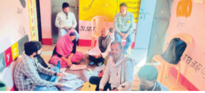
हरिभूमि न्यूज ▶▶ ब्यावरा-बोड़ा

विधानसभा क्षेत्र-160 नरसिंहगढ़ में चल रहे निर्वाचक नामावली के विशेष गहन पुनरीक्षण (एसआईआर) कार्य में लापरवाही बरतने का मामला सामने आया है। इस संबंध में अतिरिक्त तहसीलदार एवं सहायक निर्वाचक रजिस्ट्रार अधिकारी बोड़ा द्वारा कलेक्टर (निर्वाचन) राजगढ़ को बर्खास्त सहित प्रतिवेदन भेजा गया है।